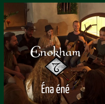
Éna éné Clip officiel (15/10/22)