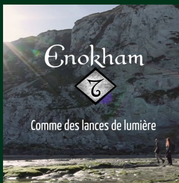
Comme des lances de lumière Clip officiel (30/09/22)