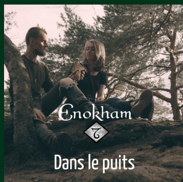
Dans le puits Clip officiel (18/09/20)

Nouvel album à écouter en avant-première